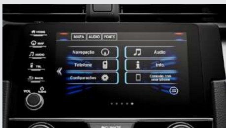
Multimídia de 7" com Navegador; Interface para Smartphone. (versões EXL e Touring)

Nas versões EXL e Touring , a Central Multimídia ainda agrega navegador GPS . E, para seu total conforto, a versão Touring ainda possui carregador por indução (wireless) no console central. Basta apoiar o seu smartphone 2 e, sem a necessidade de nenhum fio, o aparelho passa a ser carregado.