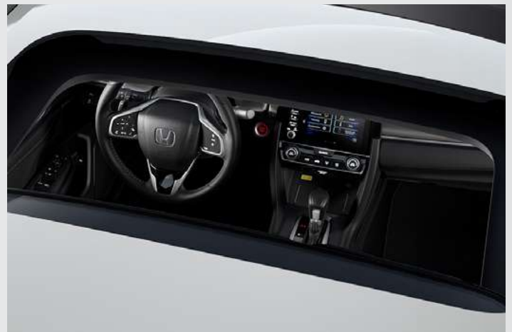
Teto Solar. (Versão Touring)

A versão Sport possui itens exclusivos como a grade frontal e rodas diamantadas com acabamento Dark e aerofólio traseiro . Além disso, as versões EX , EXL e Touring possuem a nova opção de cor interna cinza . Reforçando o refinamento do acabamento interior, todas as versões possuem painel de instrumentos macio ao toque, porta luvas e espelhos de vaidade iluminados. A versão Touring , que entrega o máximo da experiência Civic, possui teto solar com acionamento através de toque .