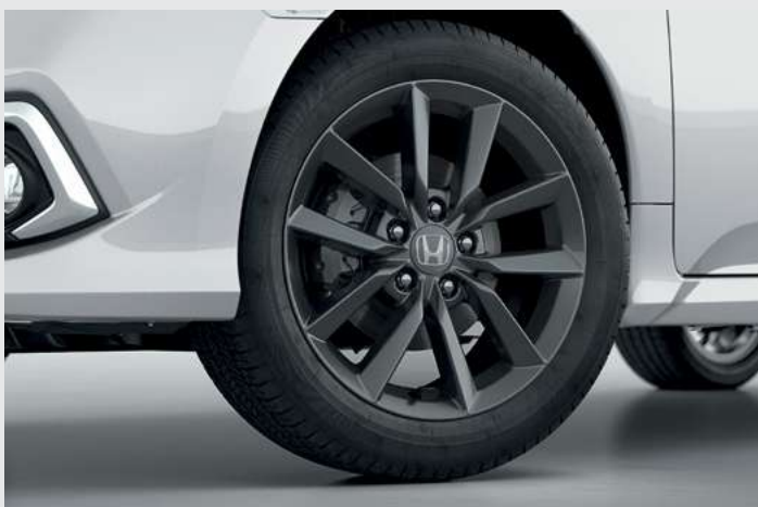
Rodas de Liga Leve 17".