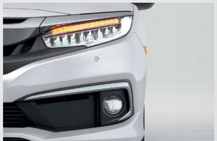
Faróis Full LED. (versões EXL e Touring)