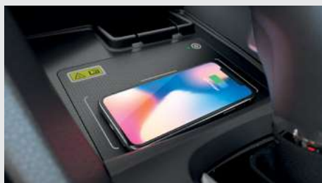
Carregador por Indução. (versão Touring)