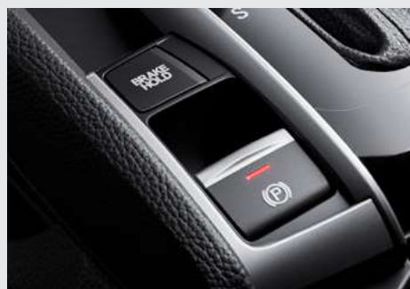
Freio de Estacionamento Eletrônico (EPB) com Função Brake Hold.