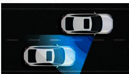
Exclusivo Sistema Honda LaneWatch™. (versão Touring)

O conjunto de suspensões é um grande diferencial para quem procura performance e estabilidade ao dirigir. Além das Suspensões Dianteiras MacPherson com barras estabilizadoras, o Honda Civic vem de série com Suspensão Traseira Multi-Link também com barras estabilizadoras que garantem conforto diferenciado e dirigibilidade excepcional.