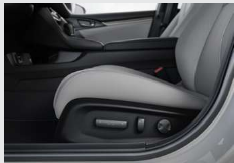
Banco do motorista com ajuste lombar e regulagens elétricas. (versão Touring)