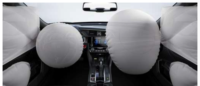
6 Airbags (2 frontais, 2 laterais e 2 de cortina).

Projetado para o seu conforto, o Honda Civic possui câmbio de transmissão automática do tipo CVT (Continuamente Variável) e, a partir da versão Sport , Paddle Shift de 7 velocidades que combinados proporcionam uma condução suave, com respostas mais precisas e aceleração linear.