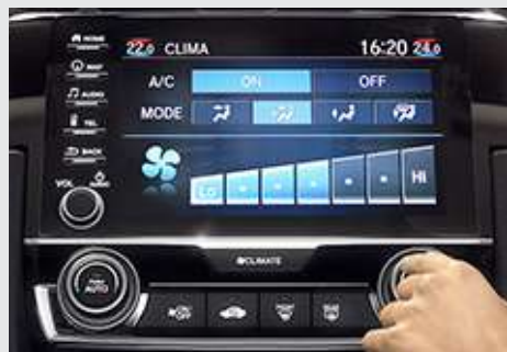
Ar-Condicionado Digital com Função Dual Zone. (versões EXL e Touring)

As versões EXL e Touring agregam sensor de chuva para acionamento automático dos limpadores de para-brisa. A versão Touring adiciona partida do motor à distância , para-brisa com isolamento acústico e o banco do motorista com ajuste lombar e regulagens elétricas para maior conforto.