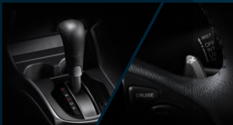
Transmissão CVT (continuamente variável) com Paddle Shift.