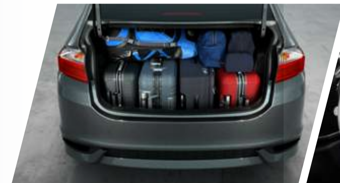
Porta-malas com 536 litros 1 .

Perfeito para acompanhar seu dia a dia na cidade e também as viagens de fim de semana, o Honda City 2021 oferece amplo espaço interno para acomodar confortavelmente 5 passageiros e um portamalas com capacidade de 536 litros 1 para carregar facilmente bagagens de diferentes tamanhos e formatos.