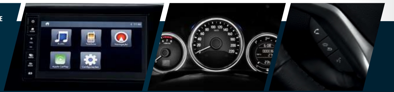
Multimídia de 7" com navegador e interface para smartphone.