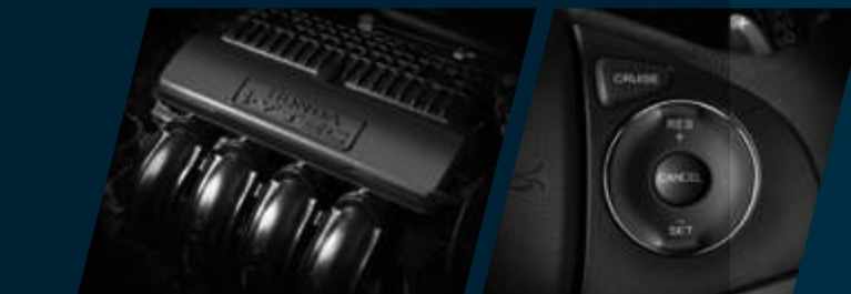
Motor 1.5i 16V SOHC i-VTEC FlexOne de 116cv.