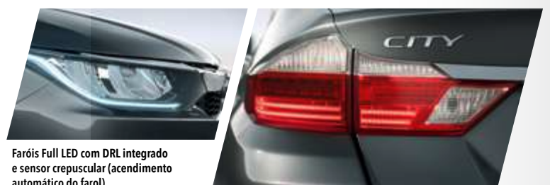
Faróis Full LED com DRL integrado e sensor crepuscular (acendimento automático do farol).

O Honda City 2021 une design com muita personalidade.