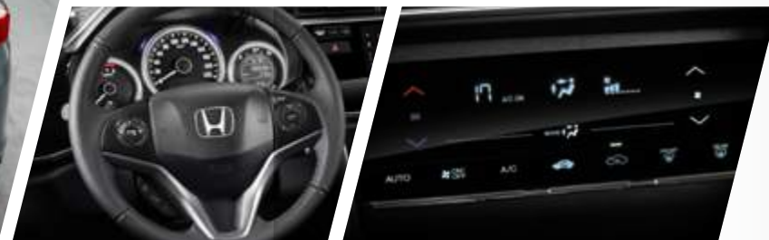
Volante multifuncional com direção elétrica progressiva e revestimento em couro.