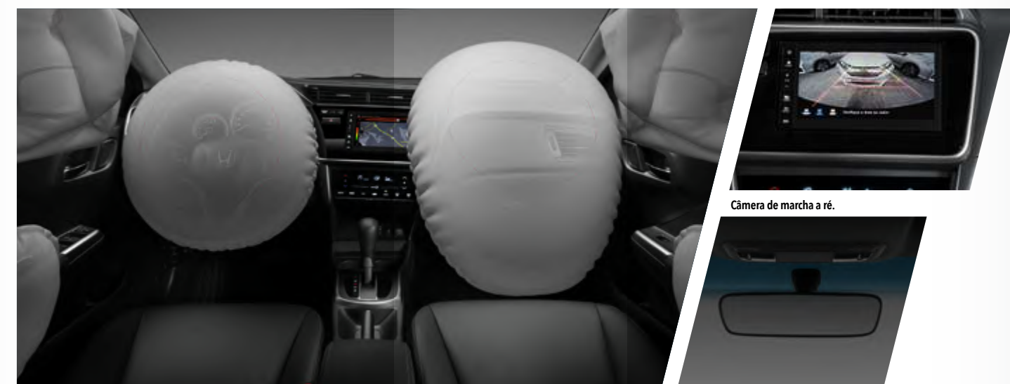
6 airbags (frontais, laterais e de cortina).

Com faróis full LED com DRL integrado , e setas indicadoras no retrovisor, o modelo proporciona mais tranquilidade no dia a dia. Já os faróis de neblina, garantem melhor visibilidade em situações adversas. O Honda City 2021 une segurança e tranquilidade para você e sua família.